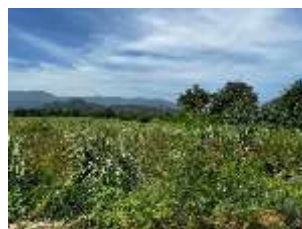
พื้นที่เกษตรกรรมใกล้เคียง (ไร่อ้อย, มันสำปะหลัง)