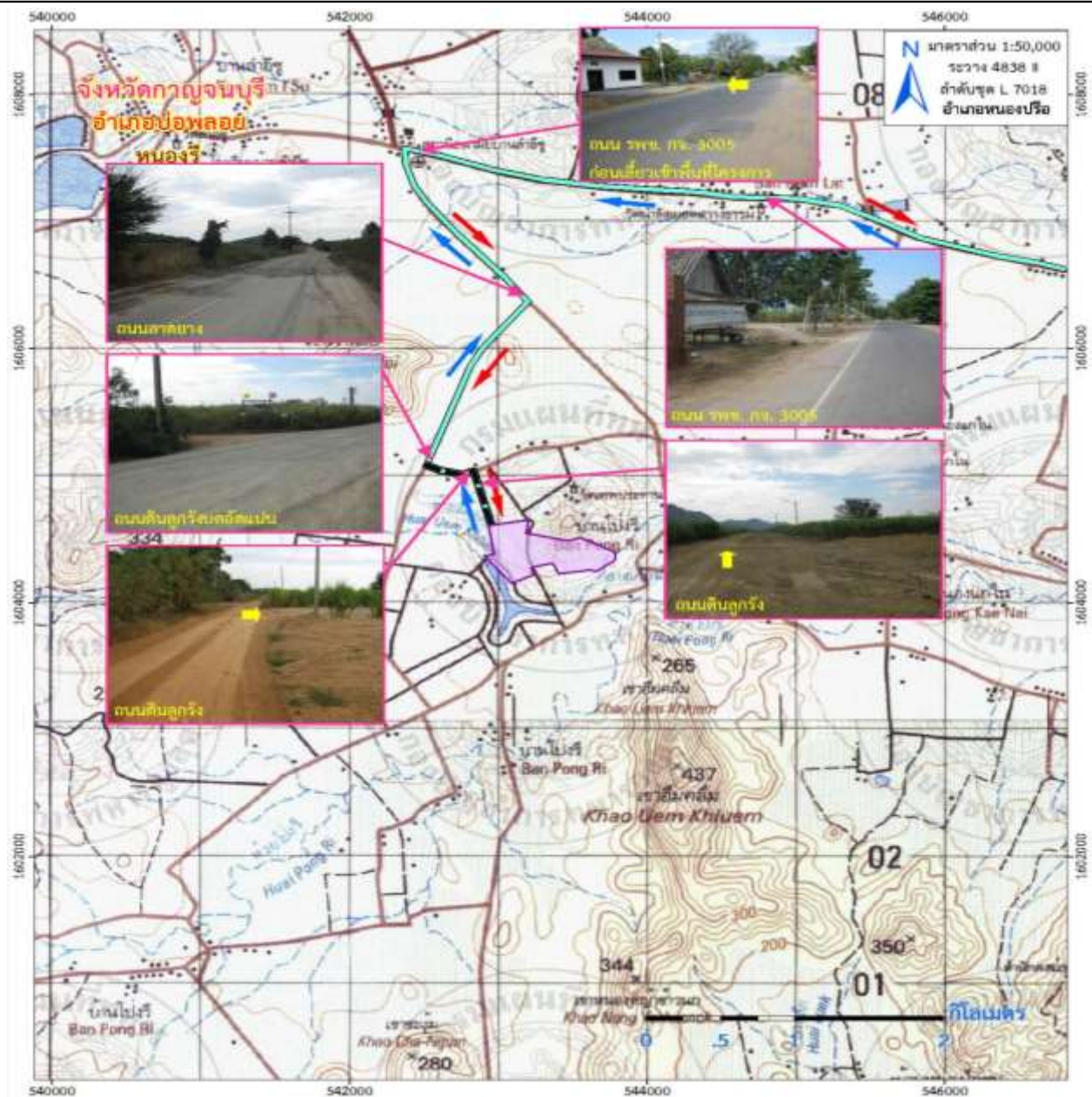
รูปที่ 1-3 แสดงการคมนาคมเข้าสู่พื้นที่โครงการ