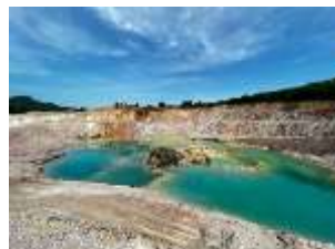
พื้นที่หน้าเหมืองปัจจุบัน (บริเวณพื้นที่ บริษัท เหมืองแร่ไทรโยค จำกัด รับช่วงการทำเหมือง)