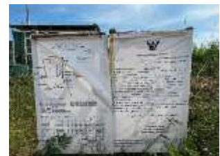
ป้ายแสดงรายละเอียดโครงการ