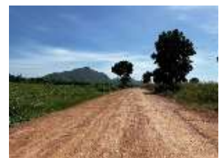
ทางสาธารณประโยชน์ ผ่านแนวหลักหมุด 11-12-13-5-6

ที่มา : www.google-earth.com (2564) และการสำรวจของภาคสนาม (2566)