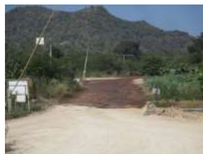
ถนนเข้า-ออกด้านหน้าพื้นที่โครงการ